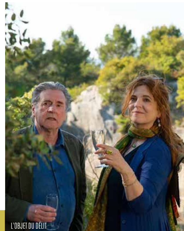
L'OBJET DU DÉLIT

Salle de la Passerelle 81 Rue Paul Massy, 17132 Meschers-sur-Gironde Téléphone 05 46 06 87 98 Répondeur 05 46 06 26 40 f /associationculturelleCREA i /cineassociationcrea